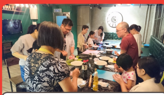
2016年5月22日 過敏安全餃子班+ 午餐聚會