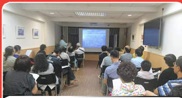
2016年6月3日 (香港哮喘會合辦) 過敏疾病成因及治療的新發展講座