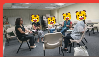
2016年7月7日 食物過敏分享小組