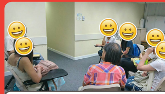
2016年5月31日 濕疹分享小組