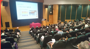
2016年6月19日 食物過敏診斷與治療講座