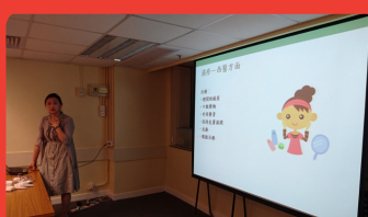
2016年6月30日 濕疹護理與濕包教學工作坊