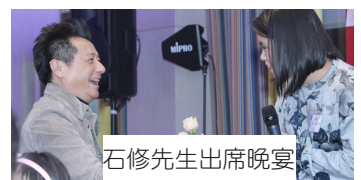
石修先生出席晚宴