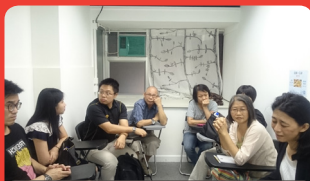
10月14日 濕疹分享小組