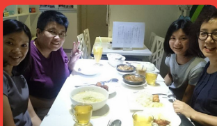
9月18日 食物過敏分享小組