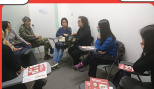
1月20日 食物過敏分享小組